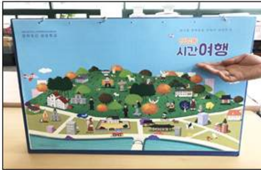
교구재 및 활동 사진